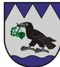
Znak obce Víška